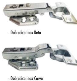
- Dobradiça Inox Reta