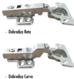
- Dobradiça Reta