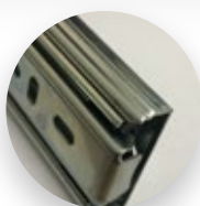
CHAPA COM DOBRA DE REFORÇO NA LATERAL