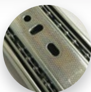
3 ESFERAS POR CARRINHO NA 45mm MAIOR RESISTÊNCIA E DURABILIDADE, MELHOR DESLIZE